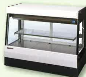
冷凍冷蔵用ショーケース など