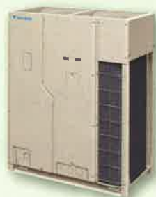
ビル用マルチエアコン